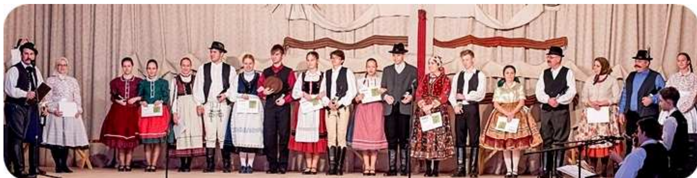
A III. Határmenti Néptánc Találkozón résztvevő együttesek képviselői az emléklappal