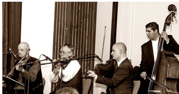
Szeredás népzenei együttes

A táncosokat a műsor után vacsora, majd éjfélig tartó mulatság várta. Minden résztvevő széles mosollyal az arcán, és jóérzéssel a lelkében búcsúzott Létavértestől.