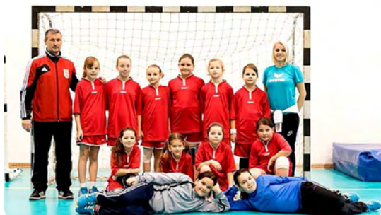
Kép és szöveg: Papp Zoltán