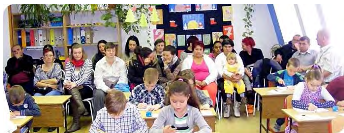
Nyílt nap az első osztályban

Iskolánk minden diákja és dolgozója bizonyosan kifogástalanul viselkedett, hiszen decemberben ismét ellátogatott hozzánk a Mikulás . December 4-én délelőtt az osztálytermekben örömteli hangulatot varázsolt a puttonyában finom csokit rejtegető, ősz szakállas öregapó és segítő krampusza.