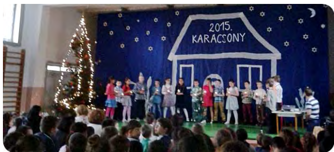
A 3. osztályosok műsora

Ezután következett a várva várt karácsonyi bazározás, ahol különböző sátrakban ingyenesen (sült tök, forralt bor, sült krumpli, hernyó tészta, mézes, szaloncukor), és jelképes összegekért (kézműves tárgyak, karácsonyi ajándékok, zsákmacska, gofri) szemezgethettek a jelenlévők.