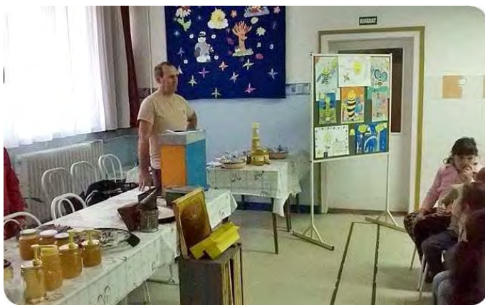
Mézéses percek

Az eseményekben egyébként is gazdag decemberi hónapot tovább „édesítette”, az Ujvárosi Méhészet előadása, mely során alsó tagozatos növendékeink megismerkedhettek a méhészek legalapvetőbb eszközeivel, és finomabbnál finomabb helyi méhek által gyűjtött mézeket kóstolhattak.