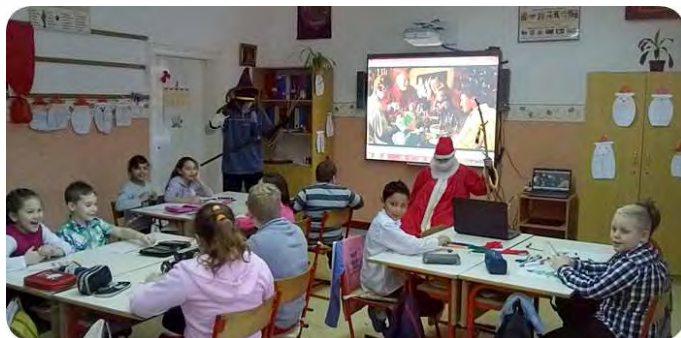
Amikor megérkezett a Mikulás

Köszönetet mondunk, mindazoknak, akik adományaikkal, munkájukkal segítettek ünnepváró programunkat: