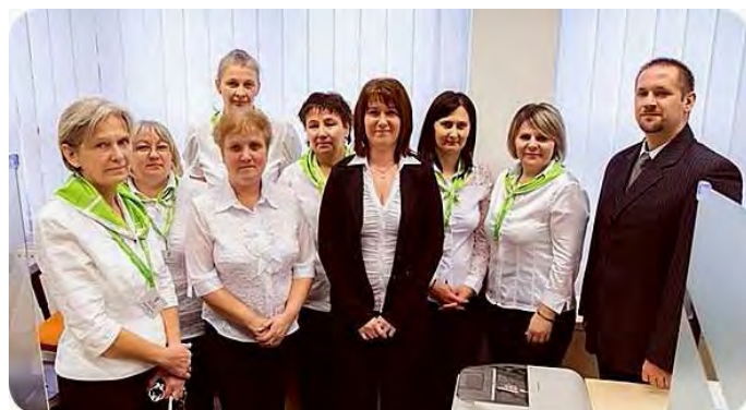
A jól felkészült apparátus helyi szakemberekből áll.

További nyugodt, jó és sikeres munkát kívánok az itt dolgozóknak. Közölve, hogy az önkormányzat továbbra is segít, mint mindig, szívesen!”