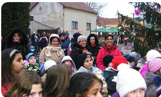
Fotó: Irinyi János Általános Iskola Irinyi utca

Az előkészítő munkát és lebonyolítást a Létavértesi Irinyi János Általános Iskola valamennyi dolgozója végezte. Hernyótészta sütést és annak ingyenes osztását a Vértesi Nyugdíjas kör vállalta. Karácsonyi mézeskalácssütést és osztást a Vértesi Református Szeretetház dolgozói végezték.